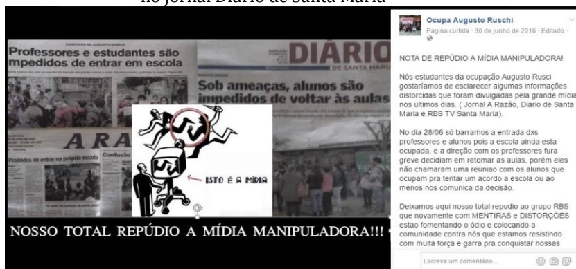
Figura 1 – Print Screen de publicação da nota de repúdio à notícia veiculada no jornal Diário de Santa Maria