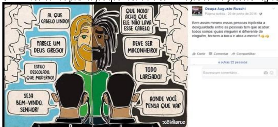
Figura 3 – Print Screen de publicação que ilustra a discriminação contra pessoas negras