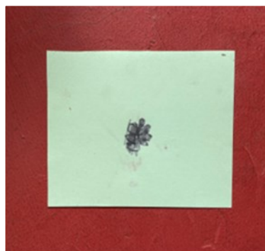
O Gato e o Passarinho

Afinal, como bem disse o poeta brasileiro, Manoel de Barros, a criança consegue escutar a cor dos passarinhos. E nós, adultos, temos que nos reconectar com essa escuta do mundo para sabermos como mostrá-la.