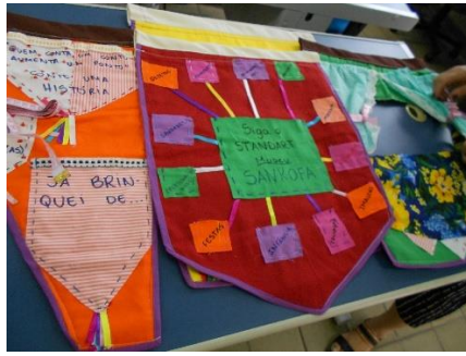
Croqui em tecido