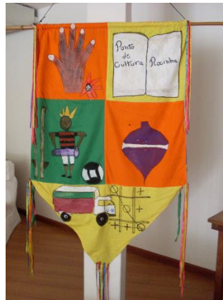
Inspiração e ponto de partida Estandarte Griô